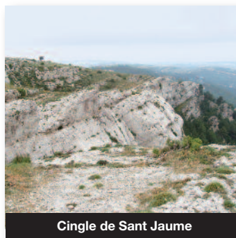
Cingle de Sant Jaume

El Cingle de Sant Jaume es un impresionante mirador natural sobre las tierras de la Tinença de Benifassà y la comarca del Mataranya. Al norte podemos ver el Tossal dels Tres Reis o del Rei, según toponimia. También podemos contemplar los macizos de L'Encanadé (cima más alta de todo este contorno) y el Tossal de l'Hereu, últimos contrafuertes del Macizo de los Puertos de Beceite. Al Oeste, las singulares y escarpadas Rocas del Masmut, el valle del Río Tastavins y en días claros una amplia vista del Bajo Aragón. Paisaje: inmenso, majestuoso, salvaje y auténtico que no da tregua a los sentidos. El silencio y el viento lo domina todo.