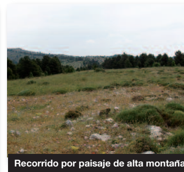
Recorrido por paisaje de alta montaña