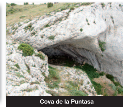
Cova de la Puntassa