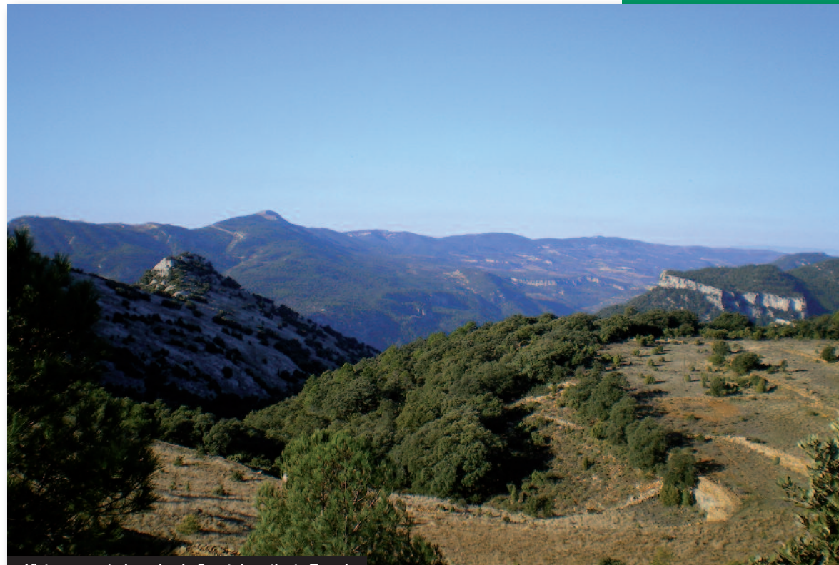
Vistas panorámicas desde Coratxà vertiente Teruel