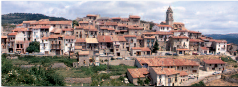
Panorámica del Boixar

Se trata de un sendero que discurre por el antiguo camino a pie entre las poblaciones de Boixar y Coratxà. Este sendero recorre los extensos prados que existen entre estas dos poblaciones, con una importante presencia de ganado vacuno. Entre los lugares más interesantes podemos destacar los siguientes: