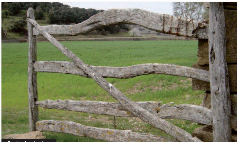
Camino de naturaleza