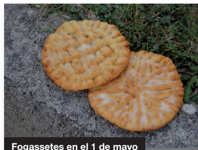
Fogassetes en el 1 de mayo