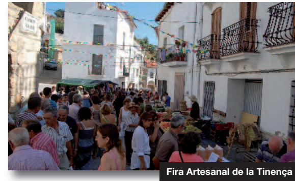
Fira Artesanal de la Tinença

Cada primer domingo del mes de octubre se celebra un encuentro popular de las gentes de la zona que se citan en el propio Tossal dels Tres Reis. Tiene el fin de confraternización de los pueblos de la zona, que están unidos por sus comunes raíces sociales y geográficas, pero separados por los límites administrativos de cada región. En el tossal se realizan unos parlamentos y la fiesta culmina con un almuerzo popular en Fredes y las tradicionales partidas de guiñote.