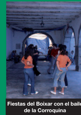
Fiestas del Boixar con el baile de la Corroquina