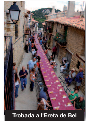
Trobada a l'Ereta de Bel