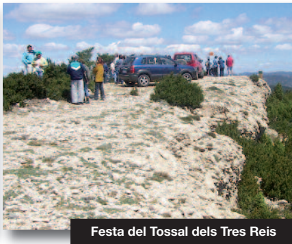
Festa del Tossal dels Tres Reis