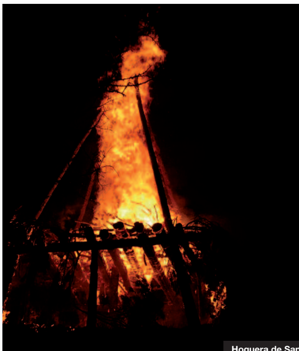
Hoguera de Sant Antoni

La Tinença de Benifassà es todavía hoy un territorio auténtico, que ha sabido conservar su cultura popular, con sus fiestas tradicionales, costumbres locales y sus propias leyendas ancestrales, convirtiéndose todo ello en un atractivo de interés turístico.