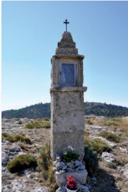
El peiró de Sant Jaume de Coratxà, símbolo de las tradiciones más arraigadas

La ruta sale desde Vallibona, asciende hacia el Mas de Prades, continua por el GR-7, para desviarse y subir hasta la Serra de les Albardes, pasar por los Boverals de Coratxà, cruzar el Barranc de l'Avellanar por el puente del Quinto y llegar al centro de esta población. Aquí en Coratxà es lugar de parada y fonda para recuperarse de la fuerte ascensión. Continuamos, a la tarde, por la senda que nos dirige hacia el Cingle de Sant Jaume, inmenso altiplano, con unas extraordinarias vistas panorámicas, para iniciar un vertiginoso descenso hasta Peñarroya de Tastavins, con las molas de las Rocas del Masmut como referencia. Se entra a esta población por el Pont Xafat, cruzando el casco urbano para llegar al Santuario de la Virgen de la Fuente. Se realiza una representación teatral popular, en la que se explica esta romería histórica. Al día siguiente se regresa, pasando por la pintoresca población de Herbes.