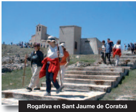
Rogativa en Sant Jaume de Coratxà