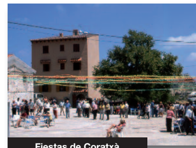
Fiestas de Coratxà