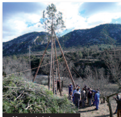
Montando la barraca