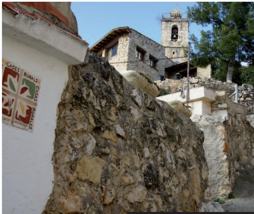
Detalle de la población de la Población de Benifassà