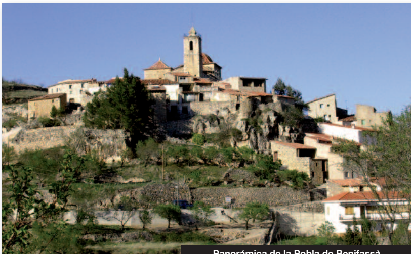
Panorámica de la Población de Benifassà

Se trata de una ruta que discurre por el antiguo camino que unía la Población con Ballestar y con la Senia. En este trayecto de corta duración podemos destacar los siguientes lugares de interés: