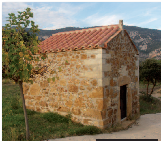
Ermita de la Trinitat