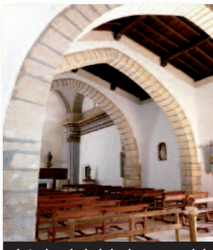
Interior de la iglesia parroquial