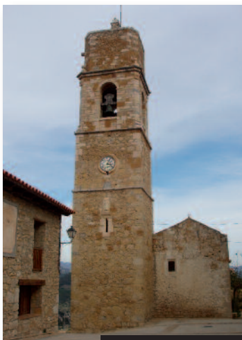
Iglesia del Ballestar