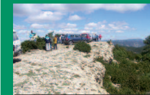
Tossal dels Treis Reis

La Tinença es una zona ideal para acoger apropiadamente al turista de naturaleza o ecoturista, ofreciendo multitud de lugares como los miradores turísticos para observar el paisaje, la fauna y la flora de uno de los entornos naturales que mejor han conservado sus valores medioambientales.