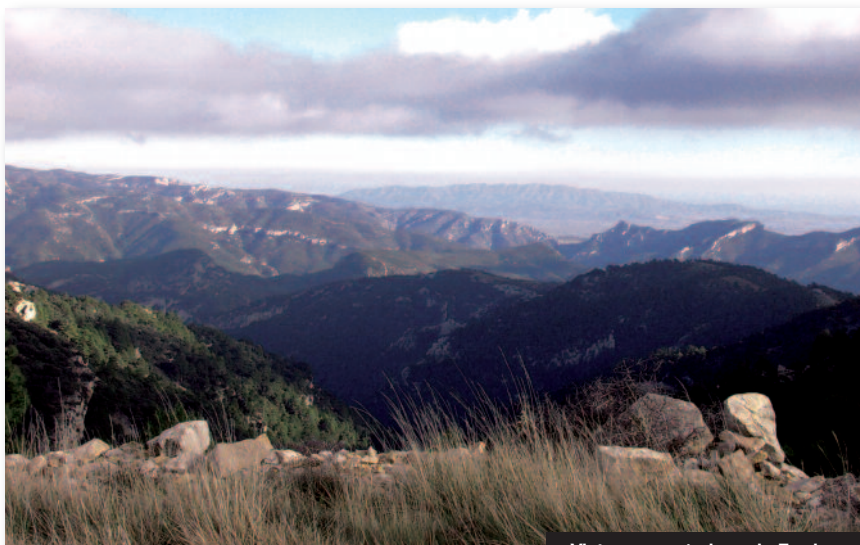
Vistas panorámicas de Fredes