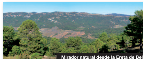
Mirador natural desde la Ereta de Bel

Los miradores turísticos de la Tinença son magníficas atalayas de su paisaje y especialmente de sus contrastes de colores. Podemos quedar impresionados por los brillantes amaneceres entre las moles rocosas, por donde rozan las caprichosas formas de las nubes. Podemos quedar sublimes por la magnitud de un entorno natural abrupto y de tamaño gigantesco con multitud de parajes de gran belleza.