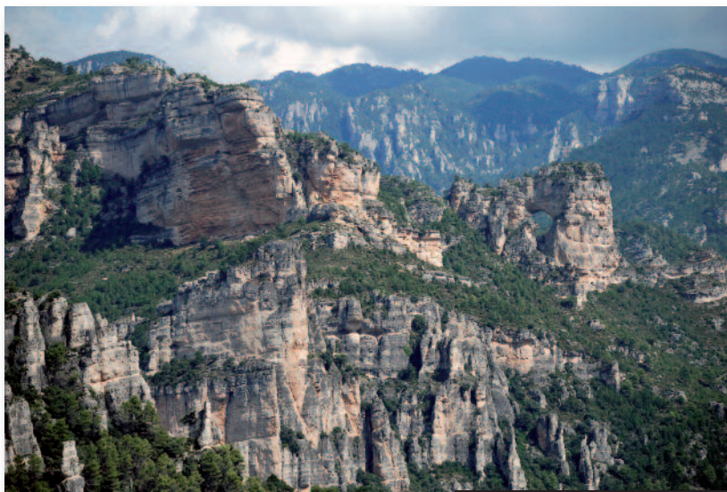
Mirador sobre la Tenalla

Se trata de una ruta novedosa y espectacular dada las impresionantes y bellas panorámicas que se observan desde cada uno de los miradores, convertidos en áreas de interpretación del paisaje.