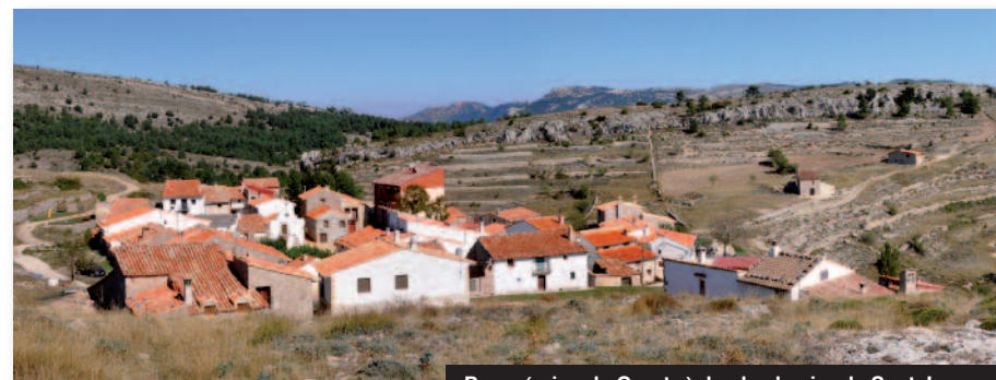
Panorámica de Coratxà desde el peiro de Sant Jaume

En Noviembre resulta conmovedor divisar los arces y las hayas aisladas entre los pinos, convertidas en perlas rojizas en la distancia. Y durante todo el año, el silencio que te acompaña por los senderos y rutas de la Tinença, antiguos caminos de trashumancia muchos de ellos.