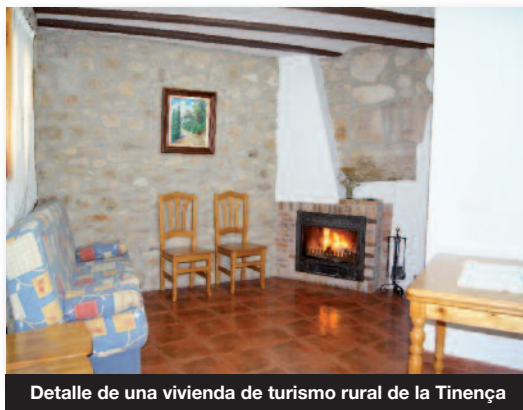
Detalle de una vivienda de turismo rural de la Tinença