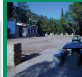
Area recreativa Ombrics de Benifassà

Área recreativa de la Font de la Roca (en Fredes)