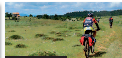
Btt en alta montaña