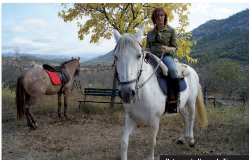
Ruta a caballo por la Tinença

El municipio de la Pobla de Benifassà, junto con las poblaciones del Ballestar, el Boixar, Coratxà y Fredes ofrecen una diversificada oferta turística, con establecimientos hoteleros, viviendas de turismo rural, apartamentos, albergues, un camping y diversas áreas recreativas. Todo ello acompañado de una amplia oferta de restauración, con restaurantes en las cinco poblaciones. Esta oferta se complementa con servicios e infraestructuras turísticas.