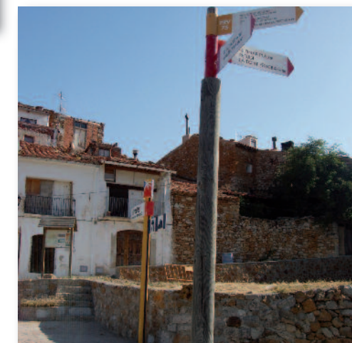
La Tinença, cruce de senderos

Lo Rebot de La Tinença Botiga de productes C. Sant Antoni, 8 (La Poble)