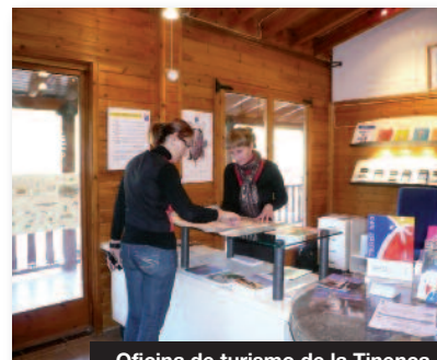
Oficina de turismo de la Tinença

Moli de l'Abad II Embarcadero y alquiler de patines de agua Ctra La Sénia- La Poble de Benifassà, km 6 Tel.977 71 34 18