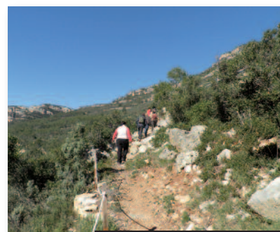
Oferta amplia de senderos