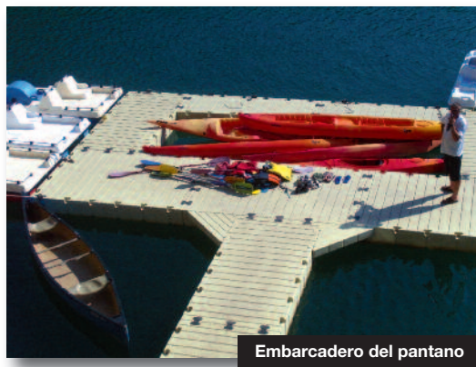
Embarcadero del pantano