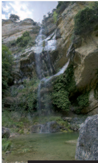
Salt de Robert

Atraviesa el Parque Natural de la Tinença de Benifassà, la Reserva Nacional de Caza y otras zonas de especial protección como LICs, ZEPAs y microreservas de flora; todos ellos espacios de gran interés por su valor medioambiental. Presenta una vegetación muy variada en función del tramo y cuenta con una fauna piscícola que conserva especies autóctonas.