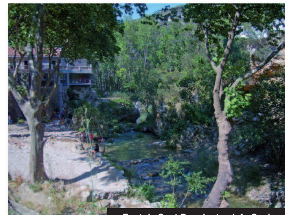
Font de Sant Pere junto al río Senia

Se trata de un recorrido muy pintoresco, con abundante vegetación de ribera junto al río y con la oferta de los complejos turísticos del Moli de l'Abad y la Font de Sant Pere.