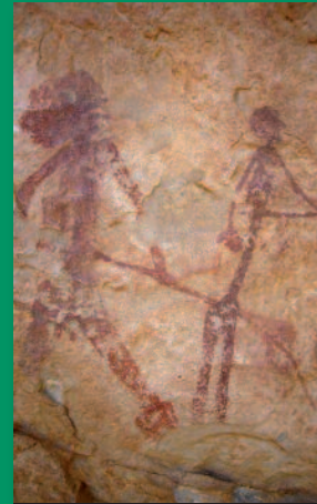
Detalle pinturas rupestres dels Rossegadors