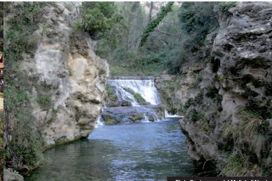
El río Senia cerca del Moli de l'Abad