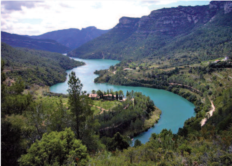
Río Senia en la cola del pantano en la zona del Mangraner

El río Senia se encuentra situado a modo de frontera entre el sur de Cataluña y el norte de la Comunitat Valenciana, recogiendo gran parte de las aguas de los barrancos de la Tinença de Benifassà. Su recorrido total tiene 66 km longitudinales y comprende una cuenca hidrográfica de 228 km 2 .