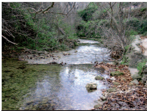
El río Senia recoge todas las aguas de la Tinença

La belleza natural del lugar le confiere la imagen de un lago rodeado de altas cumbres que se reflejan en sus cristalinas y azules aguas. La posibilidad de disfrutar de actividades acuáticas sin motor como el piragüismo, el patín de agua, la natación o de disfrutar del magnífico paisaje y de su silencio, lo convierten en un lugar paradisiaco de la naturaleza. Existe la opción de alquilar estas actividades en el embarcadero del Moli de l'Abat.