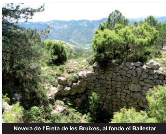
Nevera de l'Ereta de les Bruixes, al fondo el Ballestar