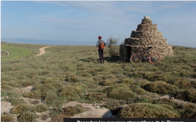
Descubre los recursos etnográficos de la Tinença

La Tinença de Benifassà es un territorio esencialmente rural en el que sus habitantes, desde tiempos ancestrales, han utilizado el medio natural para su subsistencia, generando construcciones que han legado un extraordinario patrimonio etnográfico. En un recorrido por el territorio podemos observar una gran diversidad de recursos etnográficos, como los caminos pecuarios o assagadors, caminos de arrastre o arrossegement pozos y cisternas, norias, fuentes, abrevaderos, lavaderos públicos, barracas y paredes de piedra en seco, carboneras, neveras, hornos de cal, molinos harineros, etc. Toda esta ruta representa un legado cultural etnográfico de gran valor y su conservación y divulgación supone asegurar su permanencia para las futuras generaciones.