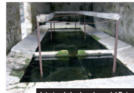
Interior de los lavaderos del Boixar