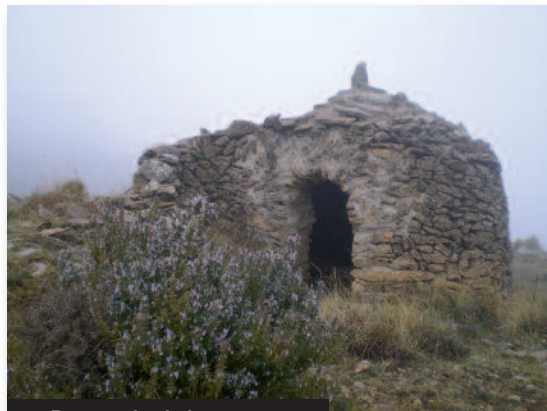
Barraca de piedra en seco

Algunos ejemplos todavía visibles son la nevera de l'Ereta de les Bruixes (en el Ballestar), los vestiqueros del Boixar o la nevera del Mas de Blanc (en Fredes).