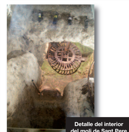
Detalle del interior del moli de Sant Pere