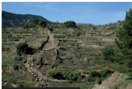
Assagador en la Tinença