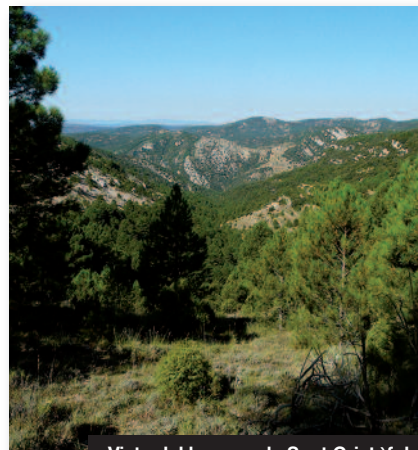
Vista del bosque de Sant Cristòfol