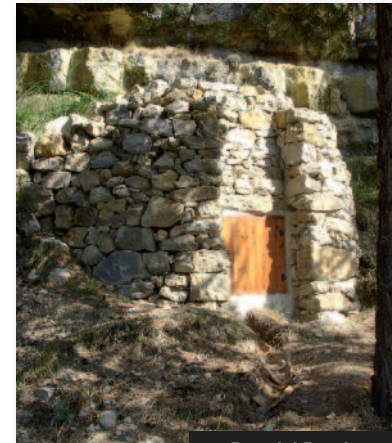
Pou del Peraire