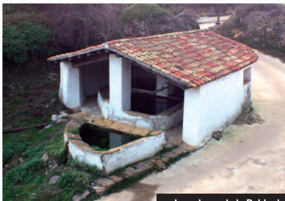
Lavaderos de la Pobla de Benifassà

La Tinença de Benifassà es un territorio esencialmente rural en el que sus habitantes, desde tiempos ancestrales, han utilizado el medio natural para su subsistencia, generando construcciones que han legado un extraordinario patrimonio etnográfico. En un recorrido por el territorio podemos observar una gran diversidad de recursos etnográficos, como los caminos pecuarios o assagadors, caminos de arrastre o arrossegement pozos y cisternas, norias, fuentes, abrevaderos, lavaderos públicos, barracas y paredes de piedra en seco, carboneras, neveras, hornos de cal, molinos harineros, etc. Toda esta ruta representa un legado cultural etnográfico de gran valor y su conservación y divulgación supone asegurar su permanencia para las futuras generaciones.