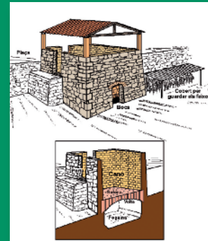
Croquis de una tejera

La estructura de la carbonera era formada por una base central, lugar donde se hacia el fuego, y alrededor la rama preparada para quemar, dejando algunos agujeros a modo de respiraderos. La pila de leña, de carrasca y de boj, se cubría con una mezcla de tierra compactada, quedando así montada la carbonera, con una forma triangular o semicircular.