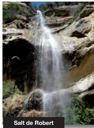
Salt de Robert