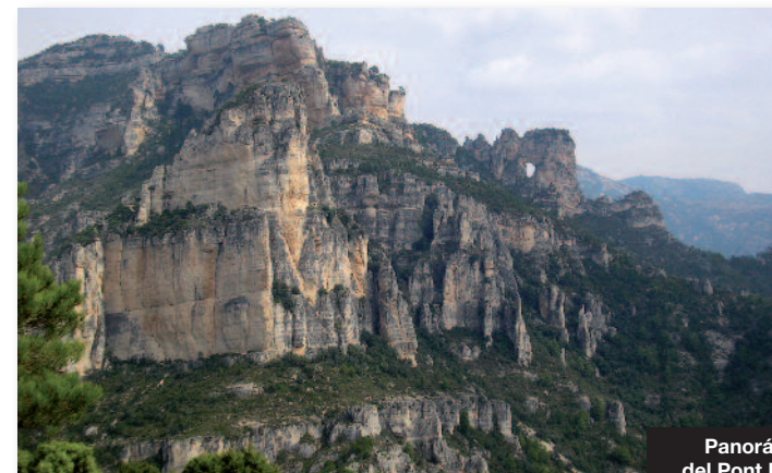
Panorámica del Pont Foradat

Entre las especies de fauna más destacadas están la cabra hispánica, las aves rapaces, el gato montés, jabalíes, muflones y la fauna piscícola. Y en el ámbito de la flora sobresalen diversos endemismos rupícolas, junto con acebos, orquídeas, violetas, fresas salvajes y numerosas plantas medicinales.