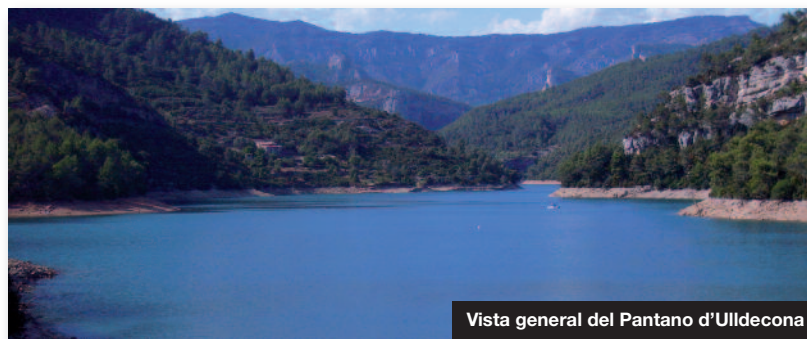
Vista general del Pantano d'Uildecona

Además de la protección que ofrece el Parque Natural, la Tinença de Benifassà se encuentra muy protegida, por tratarse de un lugar de interés comunitario (LIC) y por ser una zona de especial protección para las aves (ZEPA) y por disponer de numerosas micro-reservas de flora.