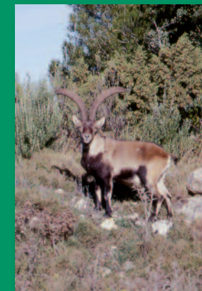
La cabra hispanica es la especie mas representativa del parque natural

La diversidad y el estado de conservación del medio natural de la Tinença han despertado la admiración de numerosos especialistas de los campos del análisis territorial y las ciencias ambientales. Afirmaciones como “la calidad ambiental de sus pueblos es de las mejores de la Comunitat Valenciana” corroboran esta realidad que ha sido posible por la explotación sostenible de forma armónica de sus moradores a lo largo de más de 2.000 años