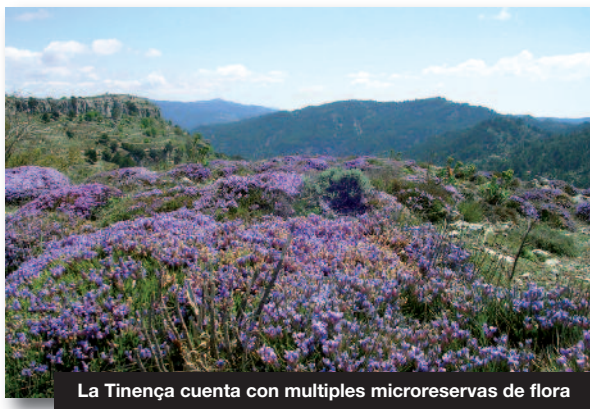
La Tinença cuenta con múltiples microreservas de flora