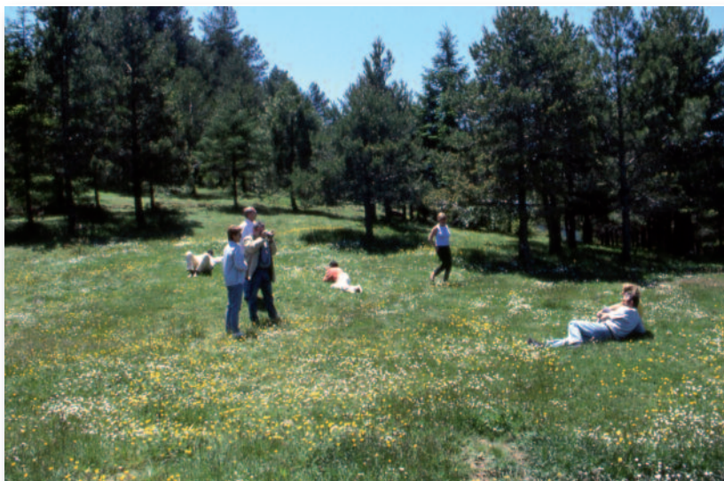
La Tinença es un paraíso para los amantes de la naturaleza

La Tinença de Benifassà se puede considerar una comarca natural propia, cuya preservación ha sido posible porque la zona se mantuvo al margen del desarrollo económico de los últimos 100 años.